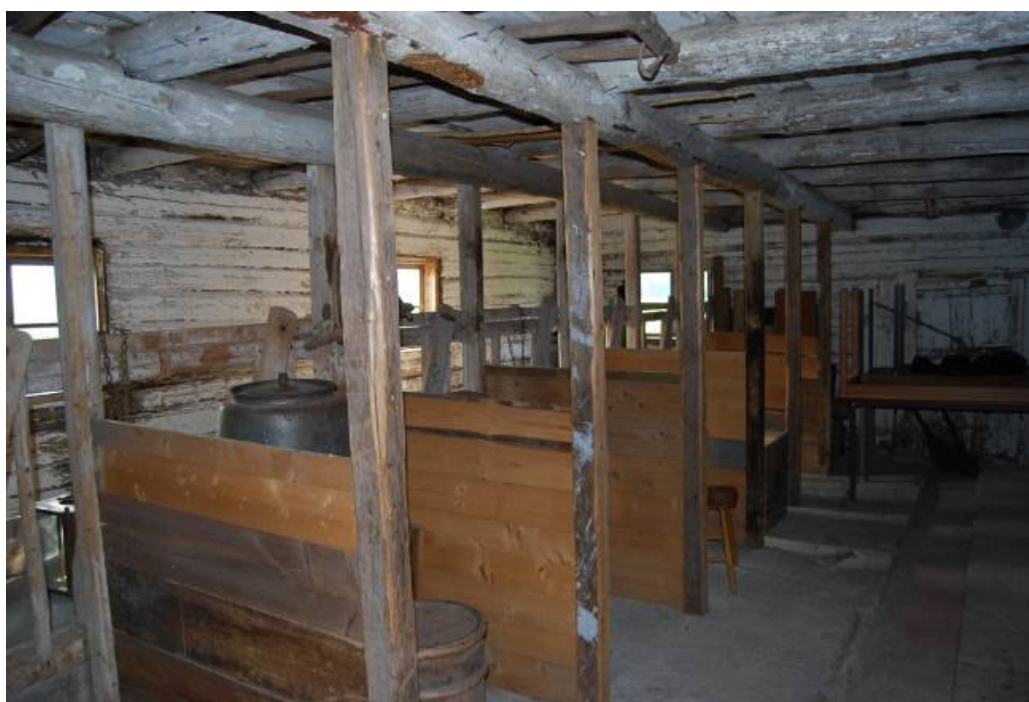
Kobåsen med nygjorda mellanväggar. MOW