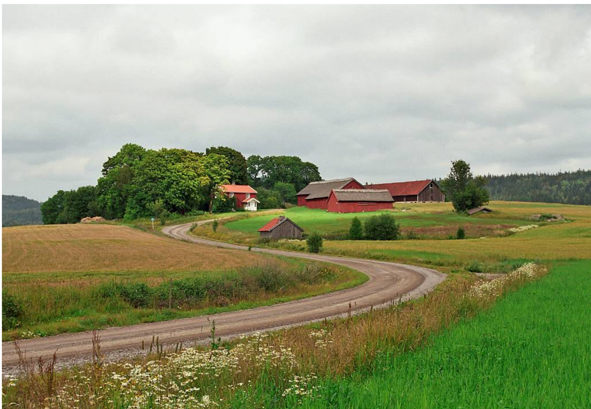
Översikt över Vinnsäter 1:33 med smedjan i förgrunden. Bilden är tagen före toalettbyggnadens uppförande. OE

Mot bakgrund av ovan sagda och det faktum att vi bland länets byggnadsminnen har få kompletta gårdsmiljöer och ingen skyddad Dalslandsstuga uppfyller Vinnsäter 1:33 absolut kraven för att komma ifråga för en byggandsminnesförklaring.