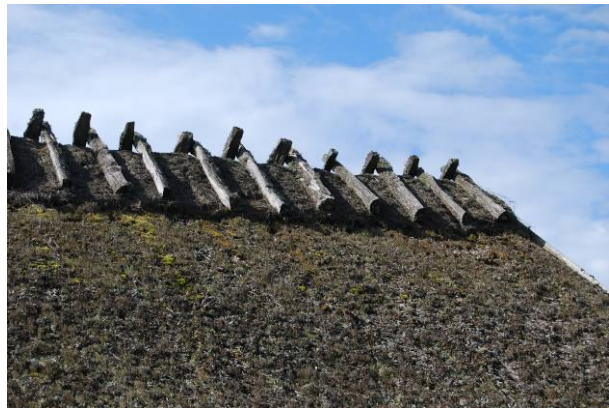
Vagnboden invändigt, längst bort skymtar dasset som är inbyggt i huset. Till höger vasstaket med ny mörning av linhalm. MOW