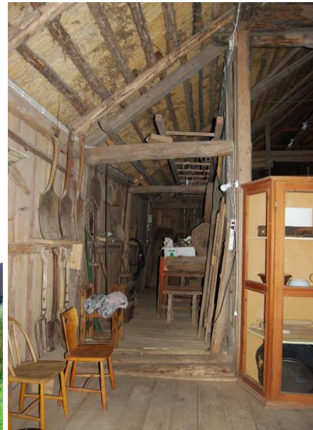
Gavel med skickan till vänster och fähusets glugg för utgödning mitt på väggen. Skickan invändigt. MOW