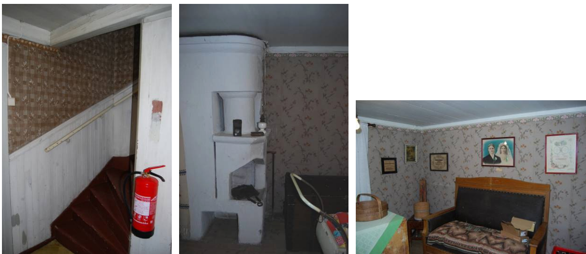
Till vänster förstugan, till höger spis och interiör från nedre kammaren. MOW

Kammaren: Kammaren ligger rakt innanför förstugan och har i alla fall under 1900 talet används som sovrum och varit möblerat med utdragssängar, bord och en kommod. Den sista tapetseringen före renoveringen, gjordes troligen på 1940 talet, taket är slätt med brädor spikade på undersidan av takbjälkarna. I ena hörnet står den fantasifullt murade spisen, eftersom kammaren endast nås ifrån förstugan och inte ifrån köket är det möjligt att rummet ursprungligen användes som förvaringsbod.