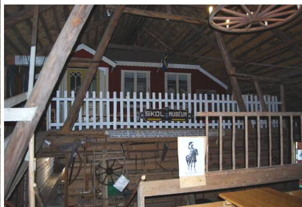
Till vänster nytt golv över foderladan och till höger skyntar skolmuseet uppe på rännet ovanpå fähuset. MOW