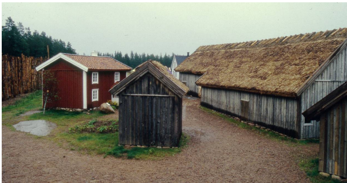
Vinnsäter i skala 1:3 med manbyggnaden, magasinet och ladugården finns på Det lilla, lilla landet i Södra Vi. MOW

Som kuriosa kan nämnas att Västarvet också har en stor modell över Vinnsäter som gjordes av dåvarande Älvsborgs läns museum i samband med upprustningen. Modellen stod några år i biblioteket i Färgelanda och visar en typisk Dalslandsgård och jordbrukssystemen under året. 2 En miniatyr av Vinnsäter (skala 1:3) finns också på Det Lilla Lilla Landet i Södra Vi norr om Vimmerby. Anläggningen är en park där man kan vandra runt i ett Sverige i miniatyr och uppleva de olika landskapens byggnadskultur. Vinnsäter representerar så klart Dalsland.