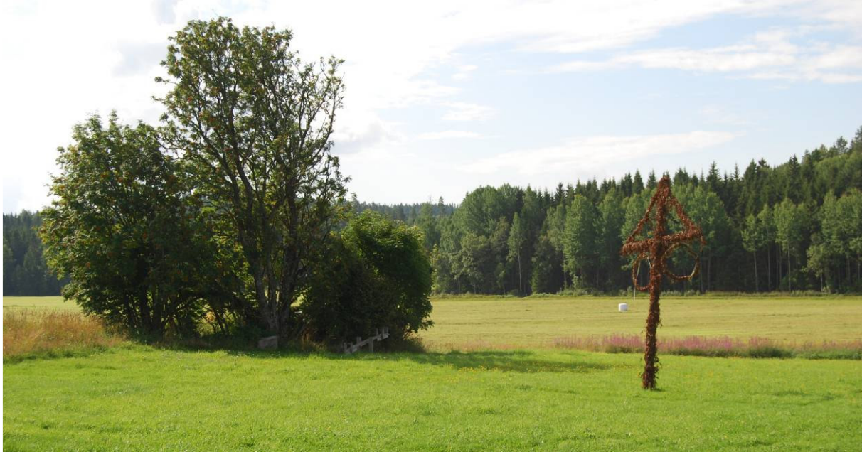
Källaren i sin dunge av uppvuxen sly. MOW

Källaren används inte. Kraftigt sly och växtlighet har vuxit upp alldeles in på källaren och skadar takkonstruktionen. Allt bör röjas bort för att inte större skada skall uppstå.