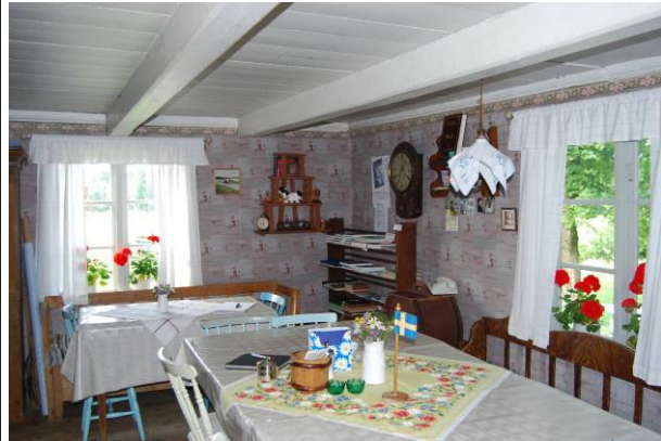
Köket med spiskomplexet. Foto från 1991 samt 2011.

Köket: Köket eller stugan är det största rummet och upptar 2/3 av husets längd och hela dess bredd. Det var också det viktigaste rummet - här har alla inomhussysslor utträttats, man har lagat mat, ätit och sovit och utfört allehanda hantverkssysslor såväl matlagningshärd, kompletterad med järnspis, som bakugn är placerad i stugan. Detta var regel i alla äldre dalslandsstugor. Från 1830-40 talen dyker det dock upp dalslandsstugor där kammaren omvandlats till kök varvid en mer differentierad planlösning erhållits, men på Vinnsäter har köksfunktionen alltid legat i stugan. Själva inredningen kan från början ha varit mer väggfast men har med tiden kommit att karaktäriserats av ett slagbord med lösa stolar, skåp, vedlår och utdragssoffor.