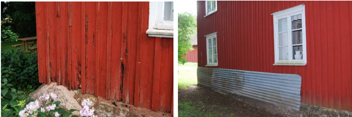
Skador på panelen på framsidan. Plåtar på baksidan. MOW

Invändigt kan man se visst slitage på några tapeter men i huvudsak är skicket gott.