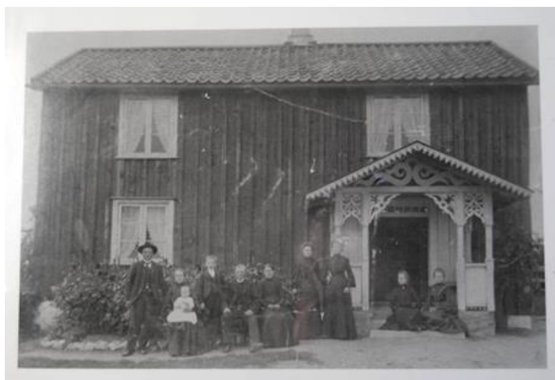
Figur 2. Vinnsätters boningshus, ca 1900. Aron Larsson med familj. Fotografiet hänger i boningshusets sal.

Boningshusets ingång har haft tre olika utseenden genom åren. Till en början fanns inget runt dörren, utom möjligtvis ett enkelt snedtak. Vid slutet av 1800-talet blev det modernt med verandor med snickarglädje och då följde även Vinnsäter gård den trenden (se figur 2). Under 1900-talet glasades verandan in och fick samtidigt en ytterdörr.