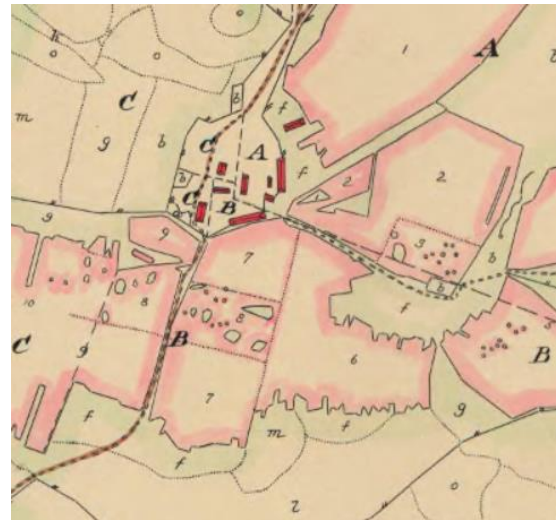
Figur 7. Storskifteskartan, 1779. Vinnsäter består då av tre eller fyra gårdar, en bit norr om nuvarande 1:33. Boningshuset och magasinet ligger idag på den åkermarksareal som markerats med "9" på kartan.

På boningshusets västra sida växer en lund som fortsätter bakom huset i nordlig riktning. Lundens består av lövträd och enligt von Schoultz (1951) är detta vanligt förekommande i dalslandsgårdar och består vanligtvis av fruktträd och t.ex ask, lönn och björk. Framför huset finns även en mindre blomsterplantering och en syrenbuske i det sydvästra hörnet. Till stora delar är resterande mark på gården gräs, med enstaka träd bakom ladan och runt om redskapsboden. All odlingsmark som tidigare tillhört marken är numera avstyckad men brukas fortfarande som åkermark.