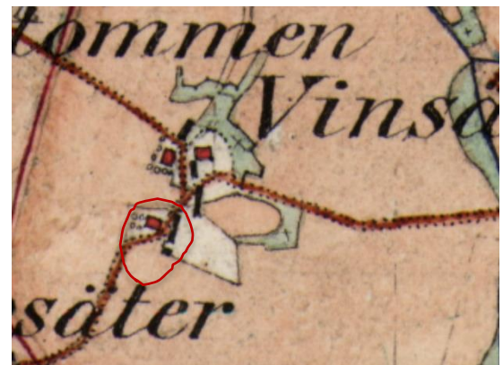
Figur 8. Häradsekonomska kartan, 1890-97. Nuvarande Vinnsäter 1:33 har här fått sin nuvarande placering. På kartan syns boningshuset, ladugården och vagnboden. Rikets allmänna kartverks arkiv.