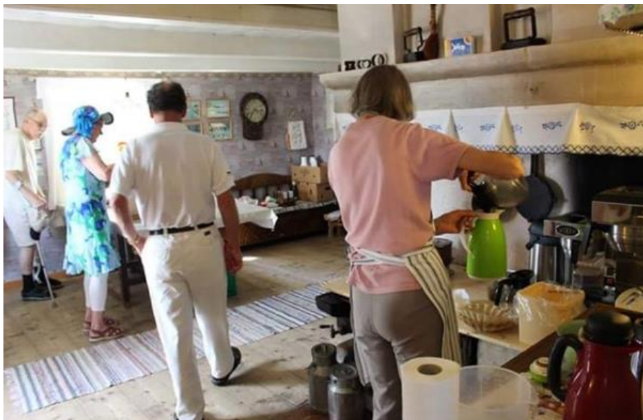
Köket. Sommarcafé.