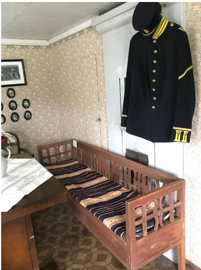
Salen, övertvåningen. Soffa framför rörspisen. Avkall från historiskt korrekt möblering för att inrymma sittplatser till caféverksamheten.