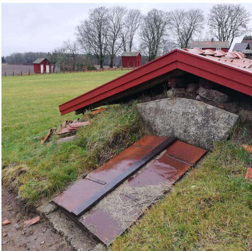
6. Jordkällaren. I bakgrunden fr. v.: toalettbyggnaden, magasinet, boningshuset.