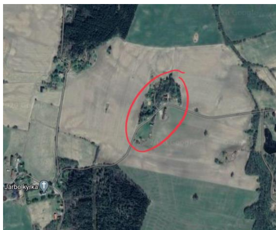
Figur 5. Flygfoto över Vinnsäter med omgivande vegetation och landskap.

Vinnsäter gård är belägen på krönläget av en höjdrygg i Järbo socken i Valbodalen och omges av ett öppet åkerlandskap. Valbodalens kuperade landskap sträcker sig genom hela Färgelanda kommun där alla gårdar är placerade på liknande sätt, på höjdlägen omgivna av åkrar och betesmarker, vilket ger dalen sin karaktär. Förleden i namnet Vinnsäter kommer troligen från ordet vind. Namnet syftar således till gårdens blåsiga höjdläge (Kungl. ortnamnkommitén, 1915).