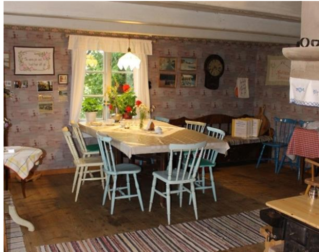
Figur 4. Köket, nuvarande inredning.

inventarieförteckningen. Nyare förvärv har inte förts in i inventarielistan. Rodin önskar att man kunde göra en gallring av föremålen, men vet inte riktigt hur detta skulle kunna genomföras (personlig kommunikation, 2020-11-05). Föremålen i boningshuset är överlag trovärdiga i den 20-30-talsmiljö de ska representera men med vissa avvikelser. Exempelvis bör kulört målade pinnstolar inte ha förekommit i denna miljö och tidsperiod, se figur 4 (Andrén, 1982). Sedan ett tiotal år tillbaka driver Järbo hembygdsförening sommarcafé i boningshuset. Husets nuvarande möblering har sedan dess delvis anpassats till caféverksamheten. I köket på nedervåningen och i övervåningens finrum finns flera sittgrupper för cafégästerna. Detta gör att rummen upplevs som något övermöblerade i förhållande till hur de rimligen bör ha varit inredda under det tidiga 1900-talet. För att kunna driva café har det också varit nödvändigt att introducera några modernare föremål i huset. I köket finns en elektrisk kokplatta och i förstugan står ett kylskåp.