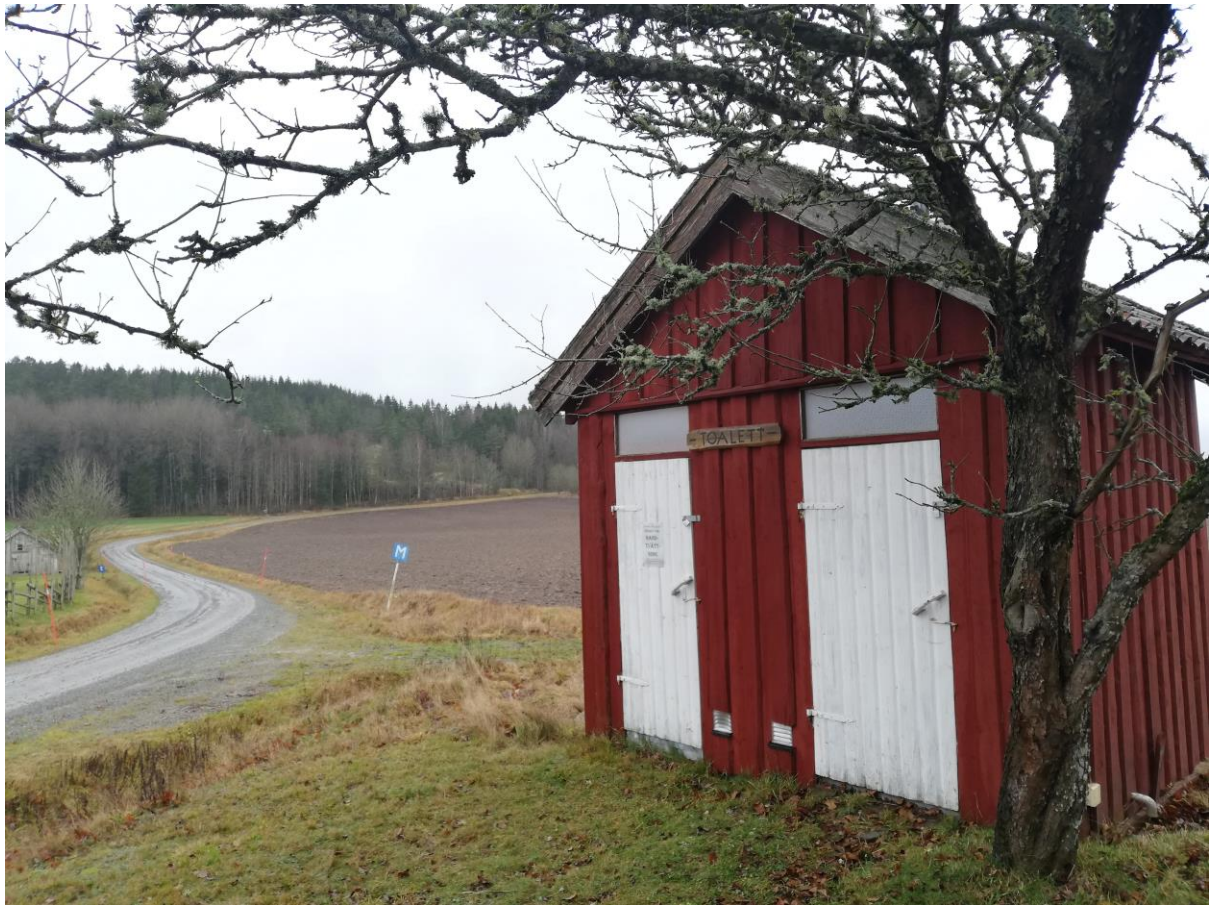
7. Toalettbyggnaden. I bakgrunden t.v. smedjan.