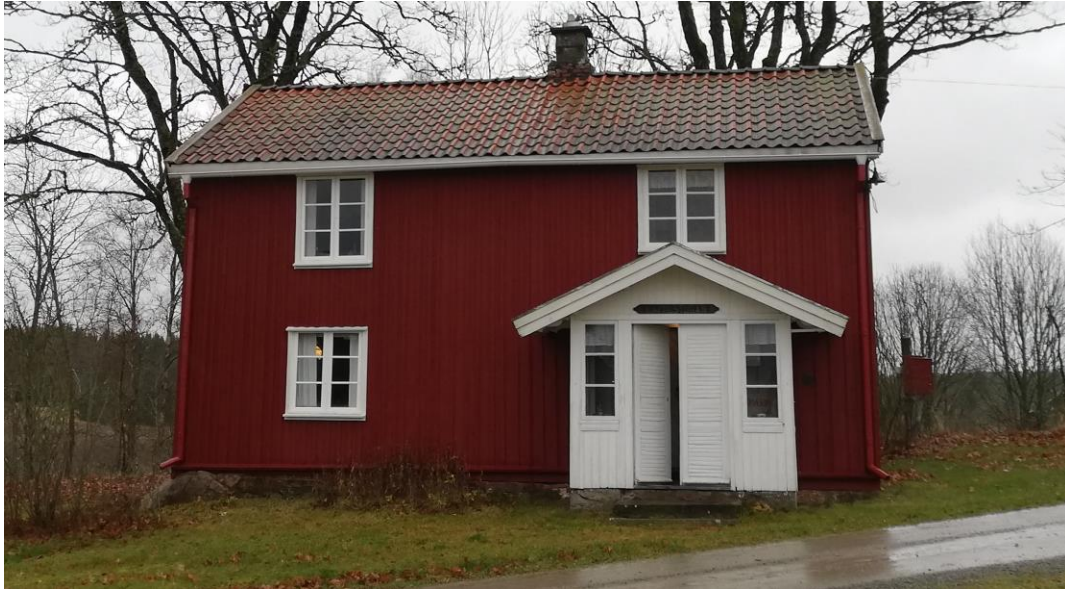
1. Boningshuset. Södra fasaden.