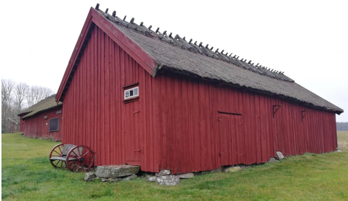
4. Vagnbod/redskapsbod. T.v. i bakgrunden ladugården.