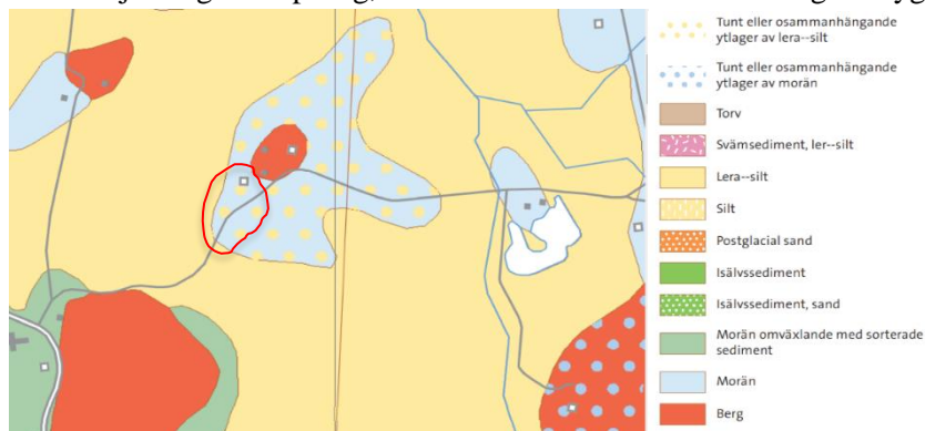
Figur 6. Utdrag ur jordartskartan, SGU. Tomtgränsen för Vinnsäter 1:33 grovt markerad inom röd linje.

På samma höjdrygg som Vinnsäter 1:33 finns idag ytterligare tre gårdar, vilka brukas som privatbostäder. Av jordartskartan och jorddjupskartan från Sveriges Geologiska Undersökning (SGU) framgår att de tre granngårdarna är byggda mer eller mindre direkt på berggrunden, medan Vinnsäter 1:33 vilar på ett moränlager på ca 5-10 m, med ett tunt ytlager av lera/silt. Regn och tjäle kan leda till att detta jordlager rör på sig, vilket i sin tur kan orsaka sättningar i byggnaderna.