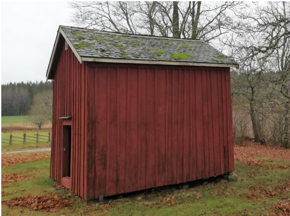
2. Magasinet.