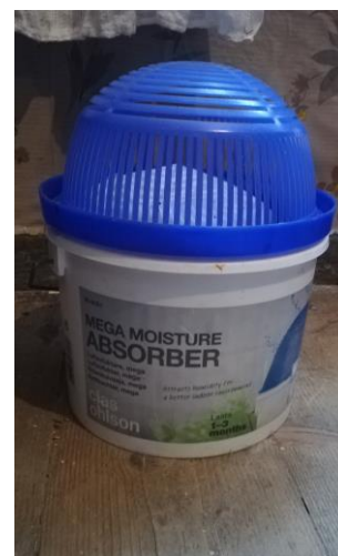
Figur 9. Luftavfuktare i övre kammaren.

Ventilation i byggnaderna sker via självdrag genom skorstenar och otätheter. Detta innebär att både relativ fuktighet och temperatur inne i husen sannolikt följer utomhusluftens värden. I VoU har Odenbring Widmark & Sellin (2014) identifierat rötskador runt fönster, flagnande färg och tapeter som släpper från väggarna i samtliga av boningshusets rum, samt misstänkta mögelproblem. Fler rötskador pekas ut i gårdens övriga byggnader. Ingen fuktmätning har utförts i anslutning till upprättandet av VoU, men skadorna tyder på en underliggande fuktproblematik. Under vinterhalvåret, när den relativa luftfuktigheten ofta är hög, finns stor risk för kondensbildning på kalla ytor, vilket skulle kunna vara orsaken till flera av de skador som noteras i VoU. För att åtgärda skador på tapeter och spisarna rekommenderar Odenbring Widmark & Sellin (2014) att föreningen anlitar konservator. Sådana åtgärder har ännu inte utförts (personlig kommunikation, 5 november 2020). För att säkra luftcirkulationen rekommenderar Odenbring Widmark & Sellin att spisspjällen hålls något öppna året runt, samt att möbler dras ut lite från väggarna. I övrigt ges inga råd om hur inomhusklimatet kan förbättras. Vintertid brukar hembygdsföreningen placera ut luftavfuktare av märket Torrbollen i boningshuset, se figur 6.