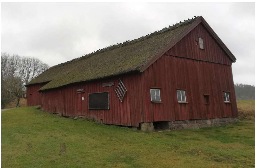
3. Ladugården.