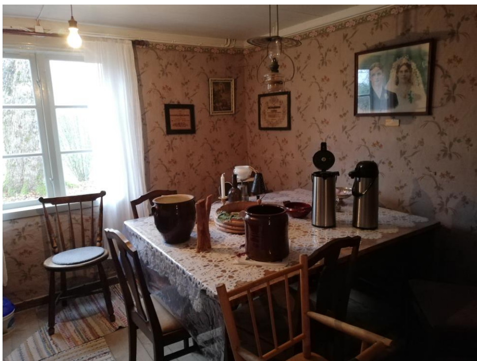
Nedre kammaren.