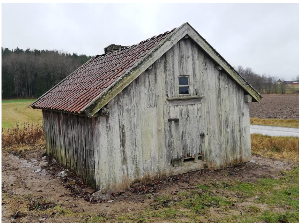
5. Smedjan.