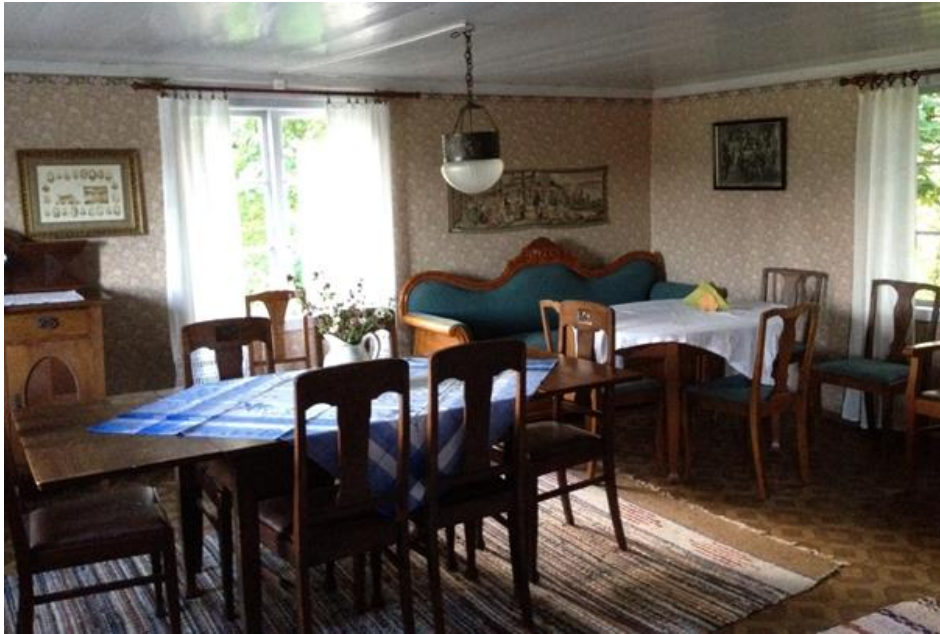
Salen, övertvåningen. Sittgrupper för cafégäster.